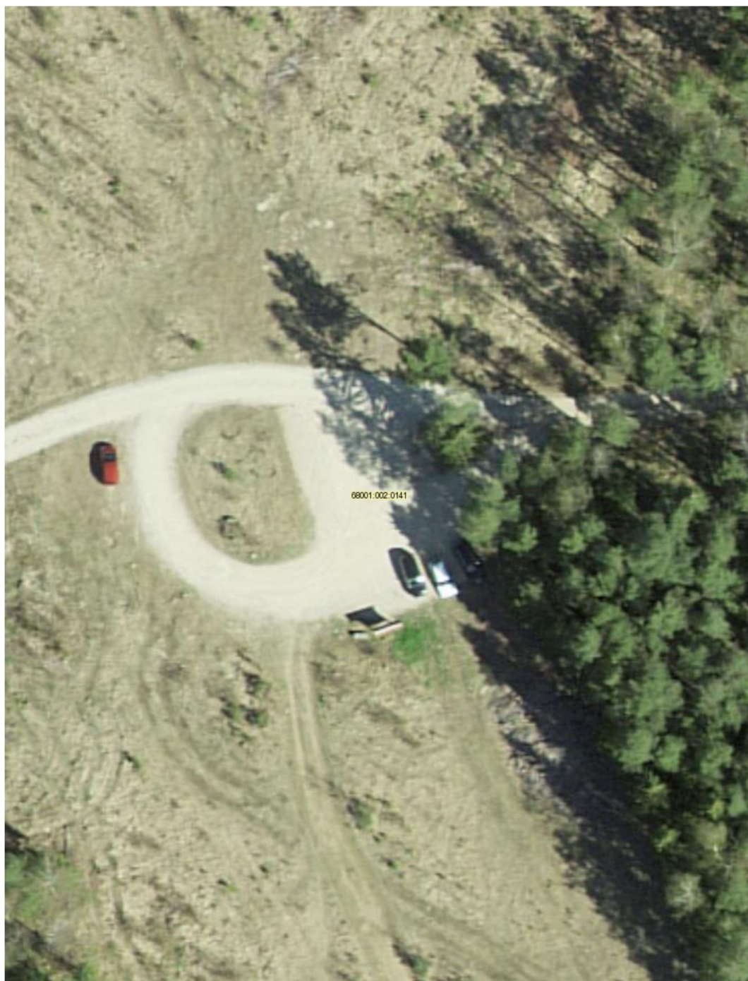
Foto 5. Olemasolev parkimisplats (Lubjaahju mü lähedal) Skeemi alusena on kasutatud Maa-ameti geoportaalist (geoportaal.maaamet.ee) saadud aluskaarti.