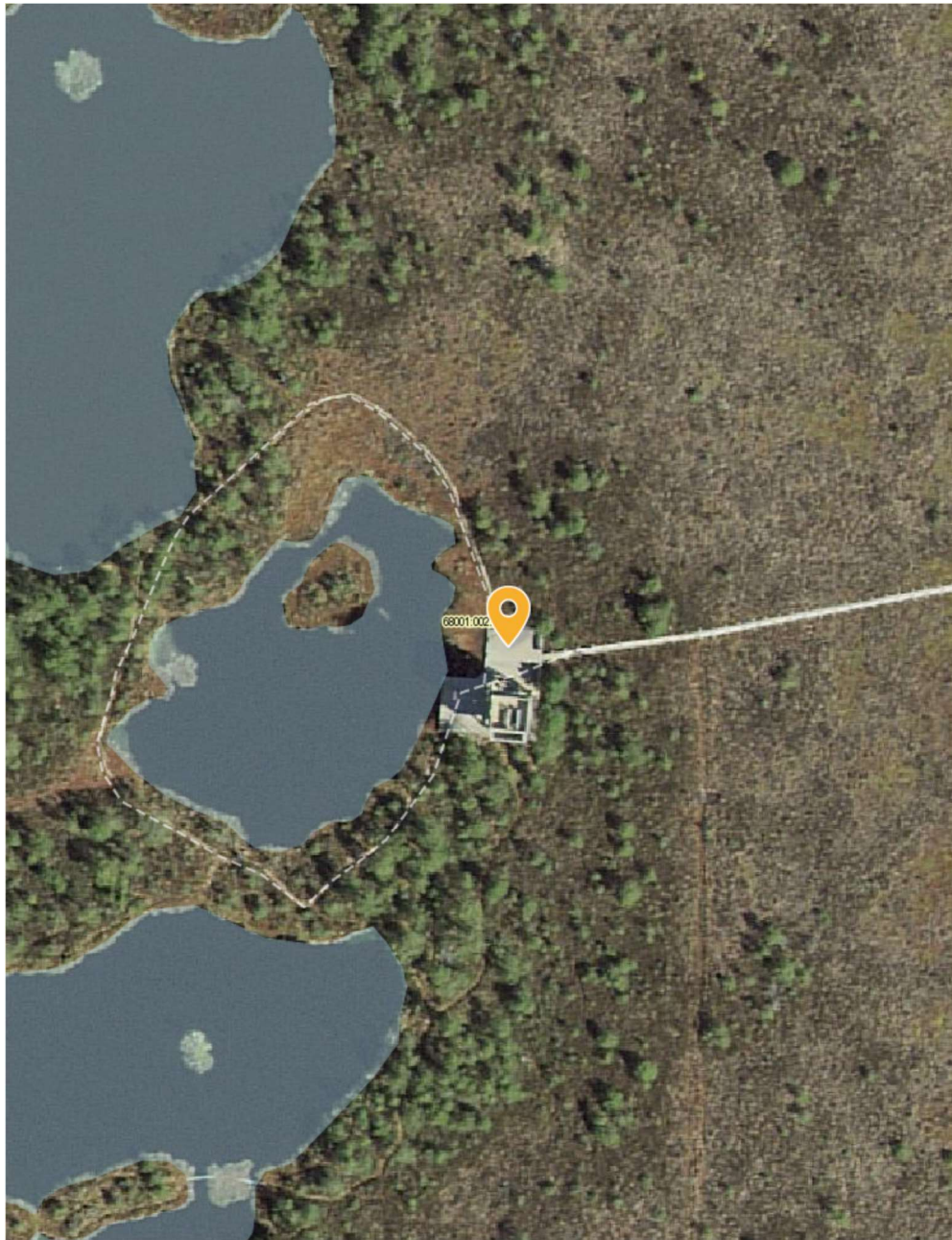
Joonis 1.2. Matkaraja asukoht (tähistatud halli joonega) Marimetsa looduskaitsealal. Halli punktiiriga on tähistatud Marimetsa lauka ringtee. Skeemi alusena on kasutatud Maa-ameti geoportaalist (geoportaal.maaamet.ee) saadud aluskaarti.